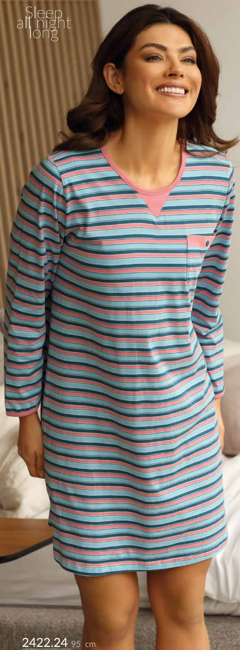
2422.24 95 cm

Single Jersey, 100% Baumwolle | 38-52 ● soft pink/62