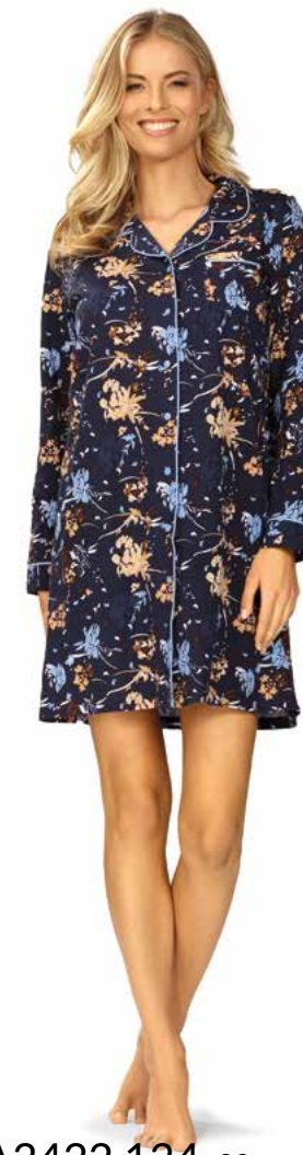
A2422.124 90 cm