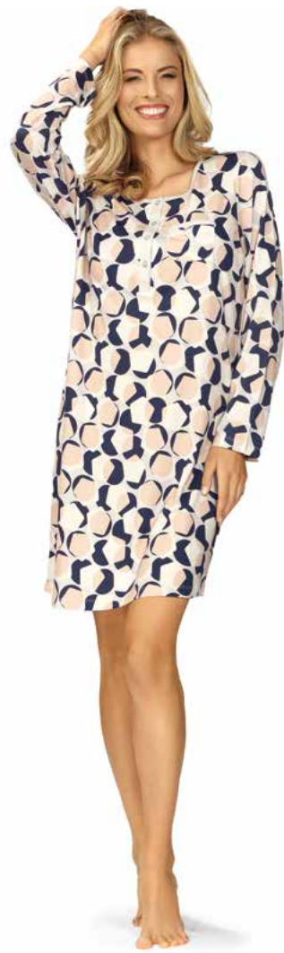
A2422.119 95 cm Single Jersey, 100% Baumwolle | 38-52 ● grey/9