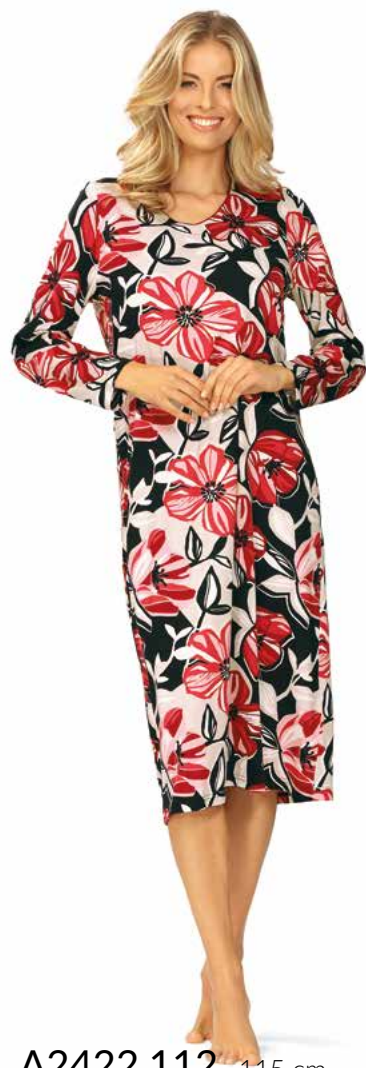
A2422.112 115 cm

Single Jersey, 50% Baumwolle, 50% Modal | 38-52 ● chili/211